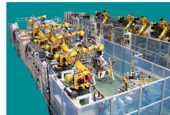
RR MBR LINE