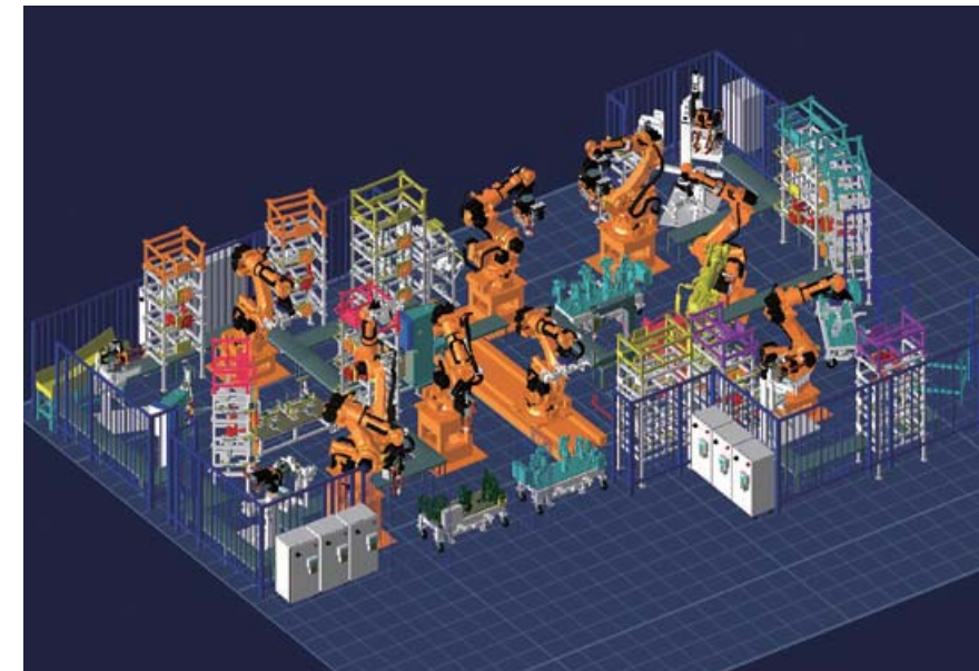
ロボットシミュレーション

プレス工程で造られた各種部品を溶接ロボットラインにて自動車のピラー部分やキャビン回り部分などの骨格部品に組み立てますが、この溶接工程でも、企画段階からシミュレーション技術を最大限に活用。高効率で高品質な製品造りを可能とする最適なライン設計を実現するとともに、溶接ラインの構築期間を短縮し、刻々と変わる市場のニーズに素早く対応しています。