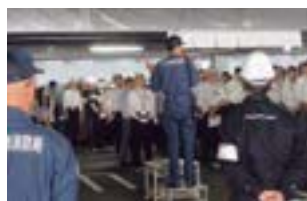
大宮本社避難訓練

火災、大規模地震に備え、日頃から防災意識を高め、また、従業員の身体、生命を守るため、各拠点において避難訓練を定期的実施しております。地域の消防署と連携し、初期消火、通報、避難の一通りの訓練を実施し、いざという時に備えております。合わせて、AEDによる救命訓練も実施すると共に、非常用食料も備蓄し帰宅困難者に対して備えをしております。