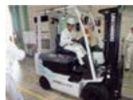
フォークリフト作業安全講習

フォークリフトの事故は死亡事故に繋がる危険性が高く、安全運転・安全作業には特に力を入れております。当社では『フォークリフト運転技能講習修了証』を保有している作業者に対して、更に独自の社内運転許可制度を取り入れ、毎年試験を行い、安全運転の技能と意識向上に努めています。昨年度はフォークリフト作業従事者に対し、過去の事故に対する振り返り教育を行うと共に、『決め事の守りきり』の重要性を認識する社内講習会を実施しました。