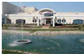
Jefferson Industries Corporation (JIC) アメリカ・オハイオ州 (設立：1988.5) 車体部品製造