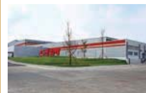
PT.G-TEKT Indonesia Manufacturing (G-TIM) インドネシア・西ジャワ州 (設立：2012.3) 車体部品製造/精密部品製造