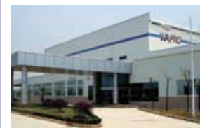
Wuhan Auto Parts Alliance Co.,Ltd. (WAPAC) 中国・湖北省 (設立：2005.3) 車体部品製造