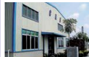
Conghua K&S Auto Parts Co., Ltd. (CKS) 中国・広東省 (設立：2005.9) 車体骨格用小物プレス部品製造