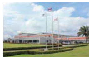
G-TEKT Eastern Co.,Ltd. (G-TEC) タイ・ラヨン県 (設立：1996.5) 車体部品製造/金型製作