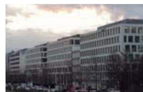
G-TEKT (Deutschland) GmbH. (G-TED) ドイツ・バイエルン州 (設立：2015.6) 情報収集/営業支援