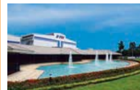
G-TEKT (Thailand) Co.,Ltd. (G-TTC) タイ・アユタヤ県 (設立：1994.10) 車体部品製造/金型製作