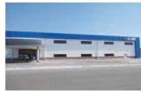
G-ONE AUTO PARTS DE MEXICO, S.A. DE C.V. (G-ONE) メキシコ・グアナファト州 (設立：2012.3) 車体部品製造