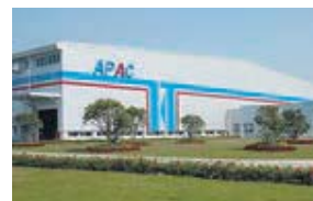
Auto Parts Alliance (China) Ltd. (APAC) 中国・広東省 (設立：2001.10) 車体部品製造/金型製作