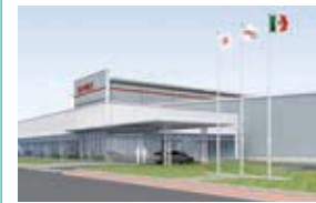
G-MEX G-TEKT MEXICO CORP.S.A.DE C.V. メキシコ・グアナファト州 (設立：2013.9) 車体部品製造/精密部品製造