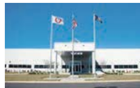
Jefferson Southern Corporation (JSC) アメリカ・ジョージア州 (設立：2000.6) 車体部品製造