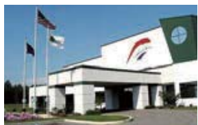
Austin Tri-Hawk Automotive, Inc. (ATA) アメリカ・インディアナ州 (設立：1998.8) 車体部品製造