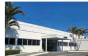
G-KT do Brasil Ltda. (G-KTB) ブラジル・サンパウロ州 (設立：1996.12) 車体部品製造