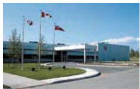
Jefferson Elora Corporation (JEC) カナダ・オンタリオ州 (設立：1996.10) 車体部品製造