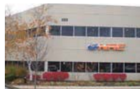
G-TEKT North America Corporation (G-NAC) アメリカ・オハイオ州 (設立：2013.4) 製品開発・研究開発・車種開発・エンジニアリング