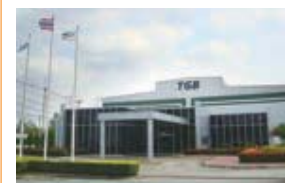
Thai G&B Manufacturing Ltd. (TGB) タイ・ラヨン県 (設立：2004.5) 車体部品製造