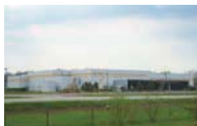
G-TEKT America Corporation (G-TAC) アメリカ・ミシガン州 (設立：1993.3) 車体部品製造