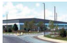
G-TEKT Europe Manufacturing Ltd. (G-TEM) イギリス・グロスター州 (設立：1997.1) 車体部品製造