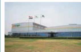
G-TEKT India Private Ltd. (G-TIP) インド・ラジャスタン州 (設立：2011.11) 車体部品製造